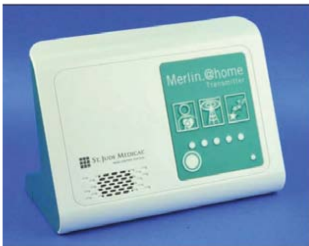
Merlin at home-monitor

Met de Merlin at home-monitor (zie afbeelding) kunnen er uitgebreide gegevens uit uw hartapparaat naar het ziekenhuis worden verstuurd via een standaard telefoonlijn, wifi of mobiel. Deze gegevens worden door de remote care verpleegkundigen in het ziekenhuis bekeken.