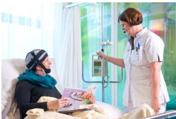
Een voorbeeld van hoofdhuidkoeling

Het kan prettig zijn om tijdens de behandeling warme sokken, een sjaal en een trui te dragen.