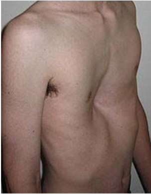
Afbeelding 1 Pectus Excavatum