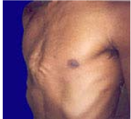
Afbeelding 2 Pectus Carinatum