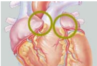
Afbeelding 3. Het linker- en rechterhartoortje

De hartoortjes zijn twee smal toelopende, oorstompe uitstulpingen aan de hartboezems (zie afbeelding 3). In deze hartoortjes wordt een hormoon aangemaakt dat de hoeveelheid vocht in het lichaam reguleert. In de hartoortjes kunnen zich bloedstolsels verzamelen, die een infarct in een orgaan kunnen veroorzaken. Dit risico verdwijnt als we het linkerhartoortje verwijderen. Een mens kan één van de twee hartoortjes missen, zonder gevolgen voor de vochtbalans.