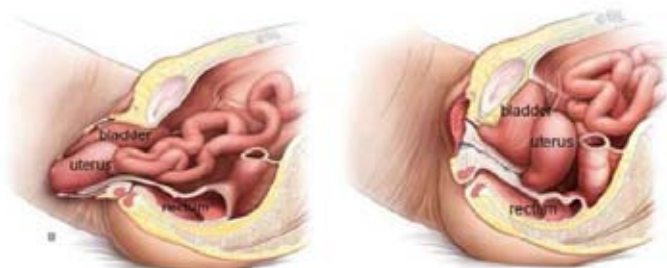
Situatie waarbij de baarmoeder is verzakt

Deze ingreep is ook mogelijk als u al een keer eerder bent geholpen aan een verzakking.